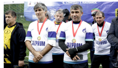
ВETERАНЫ ДАЮТ РЕЗУЛЬТАТ НЕ ТОЛЬКО НА СЛУЖБЕ!