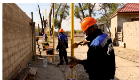
О ХОДЕ ДОГАЗИФИКАЦИИ - ОКТЯБРЬ