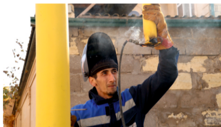
«ДОГАЗИФИКАЦИЯ» ДАГЕСТАНА ПОВЫСИТ КАЧЕСТВО ЖИЗНИ